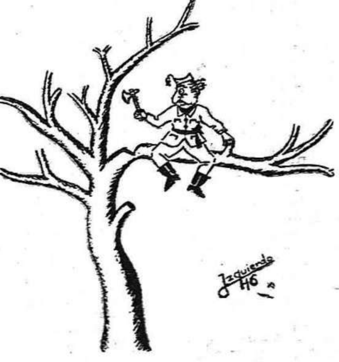
Me parece que voy a caer... (IZQUIERDO).