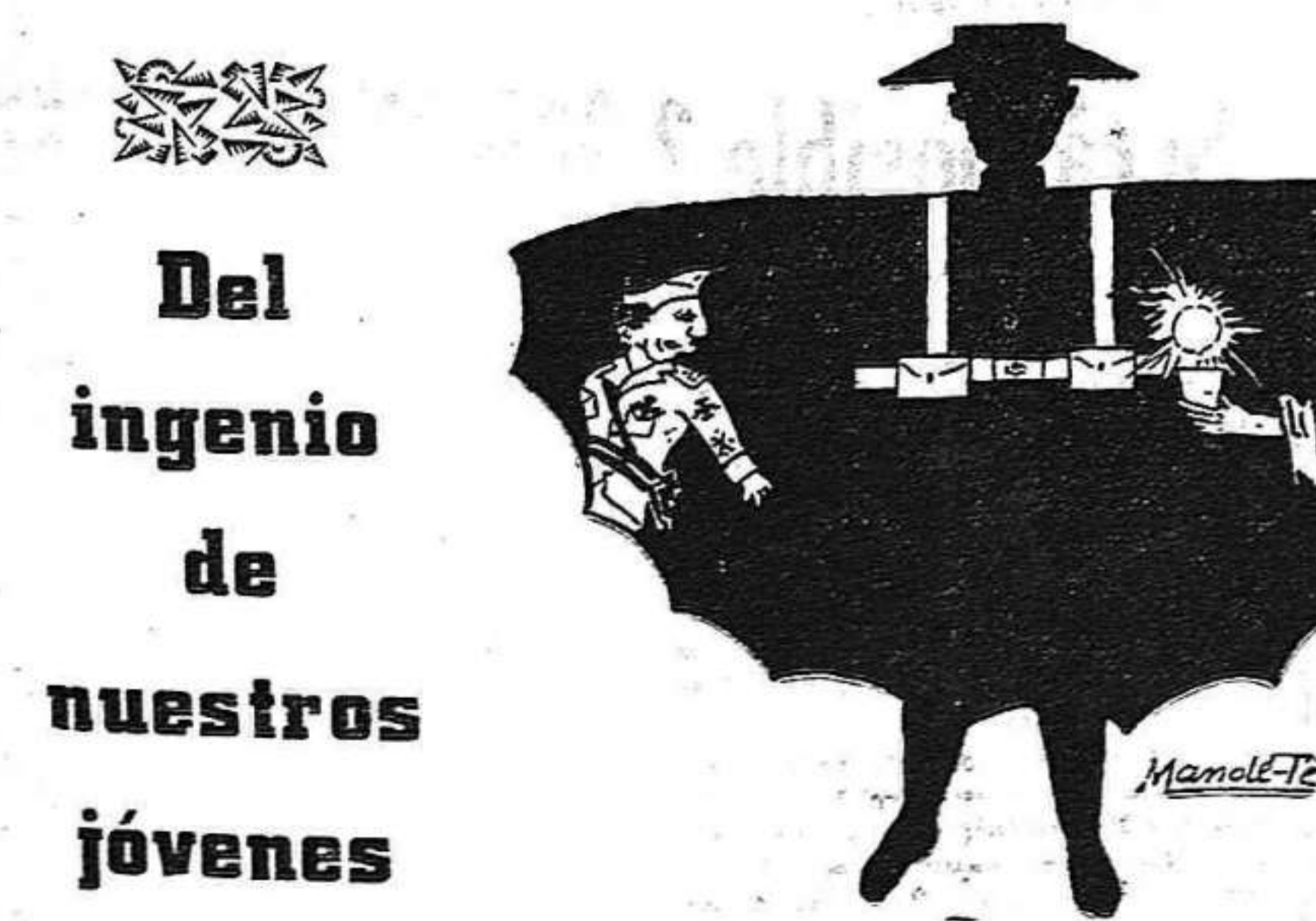
Del ingenio de nuestros jóvenes

Es un viejo amigo, veterano en estas lides, que actuó ya por el medio día. Me doy cuenta de inmediato que todos le quieren. Antes del ensayo, cambiamos impresiones: — Os gusta la obra que ensayáis? — Sí. El compañero director deja a los demás que contesten a mis preguntas. — Por qué os gusta? — A nuestro juicio, vale. Ya leerás: «Esperanza nuestra», de Martínez Sierra, comedia social que se impone por su tono y colorido; y creamos que ha de gustar. — Y las gentes del barrio, ¿qué os dicen? — Ya nos conocen. Y todos estos jóvenes son de por aquí, compañeros que estiman bien nuestra causa libertaria. Nadie que pase se imagina que en este aposento viejo de feriantes y gitanos haya unos artistas y unos idealistas que trabajan.