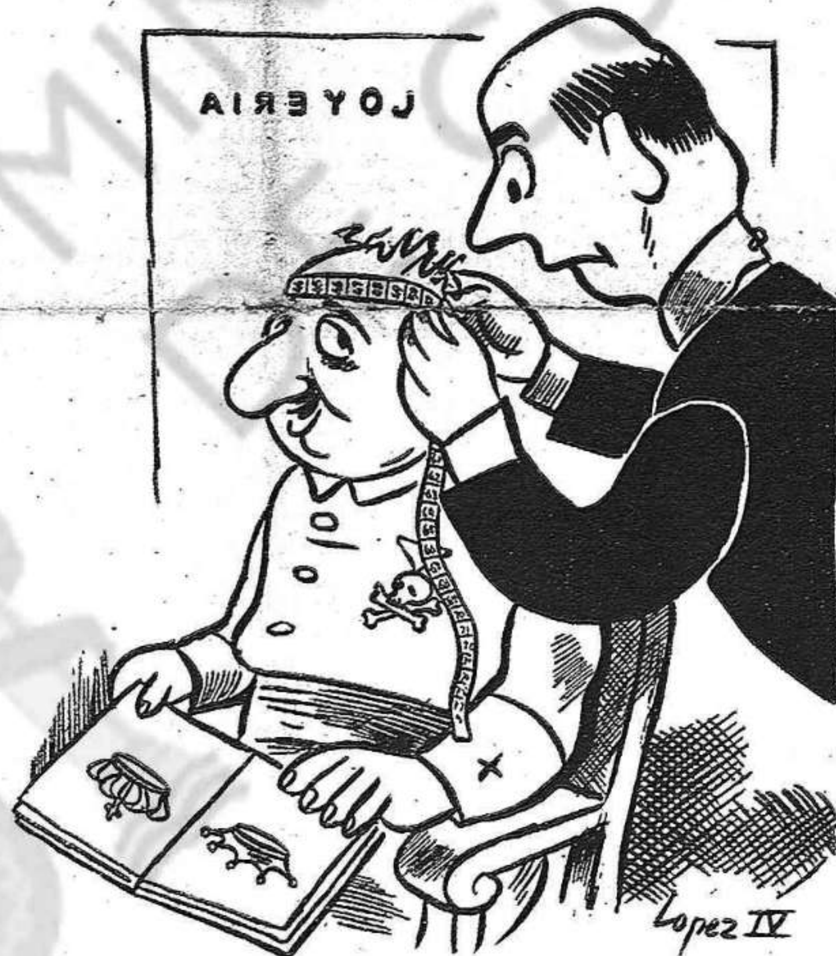
— Hágame una corona para Don Juan . . . pero a mi medida.