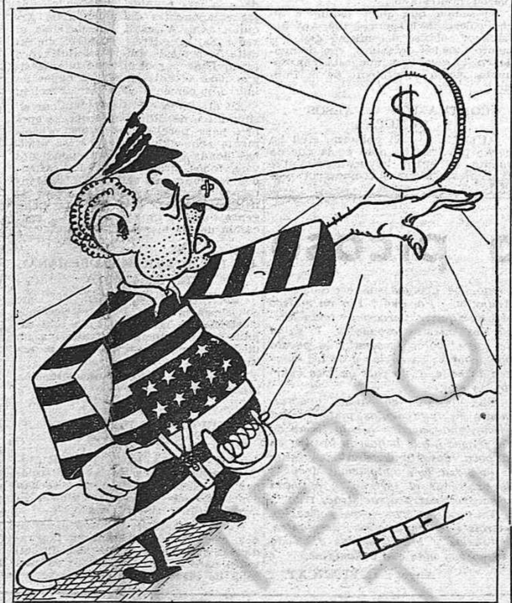
¡Cara al sol con la camisa nueva...!