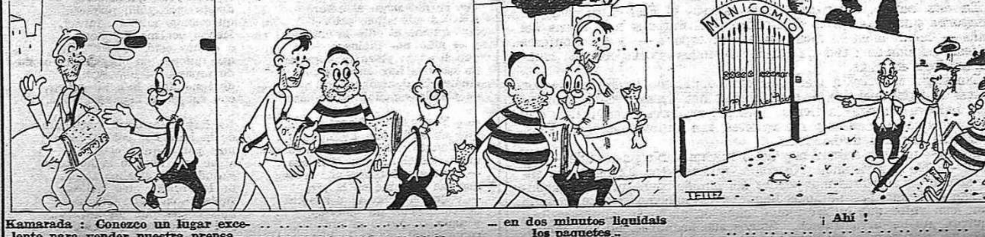
Kamarada: Conozco un lugar excelente para vender nuestra prensa. — en dos minutos liquidados los paquetes. — Ahí !