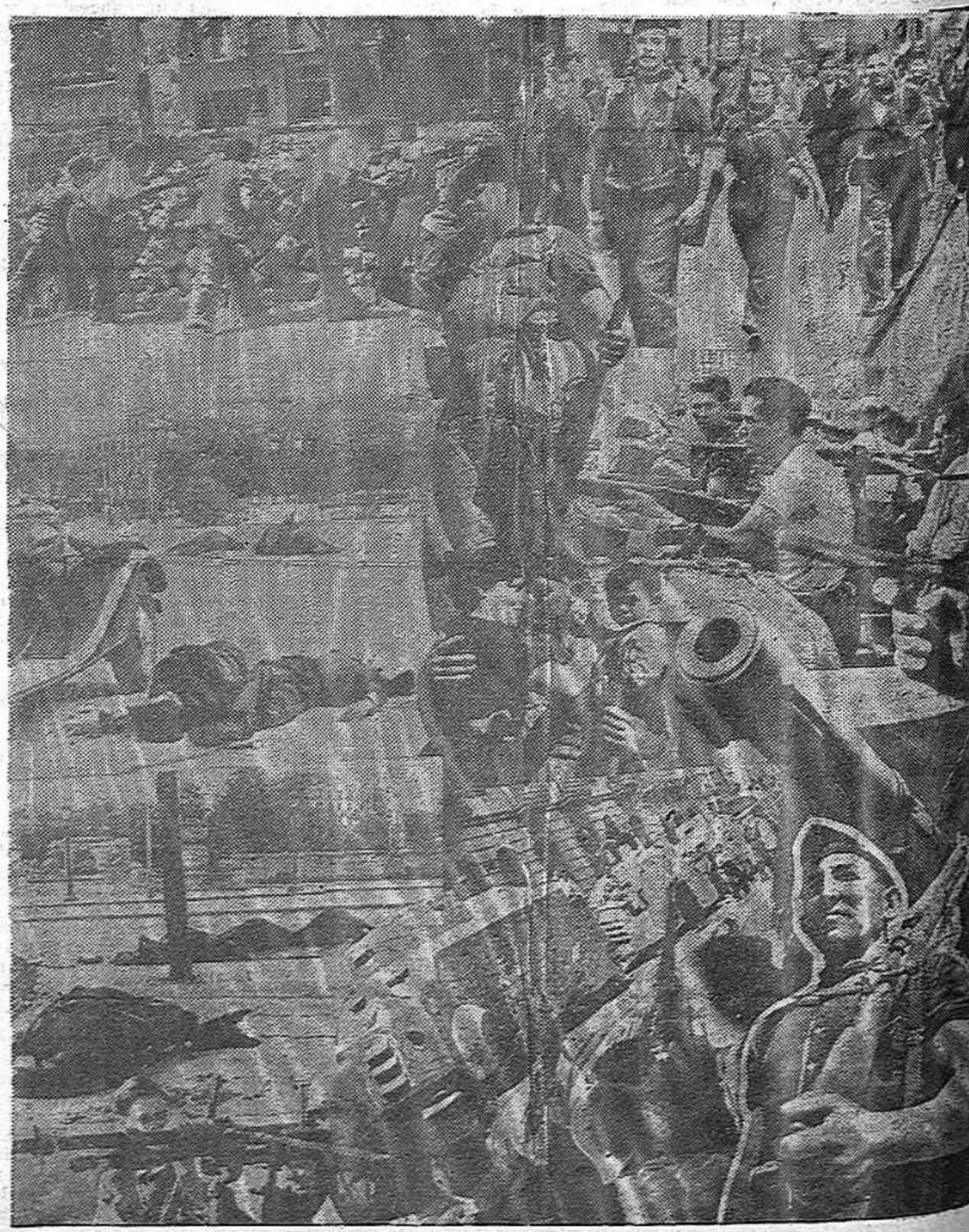
Francisco Ascaso, héros de Barcelone du prolétariat.