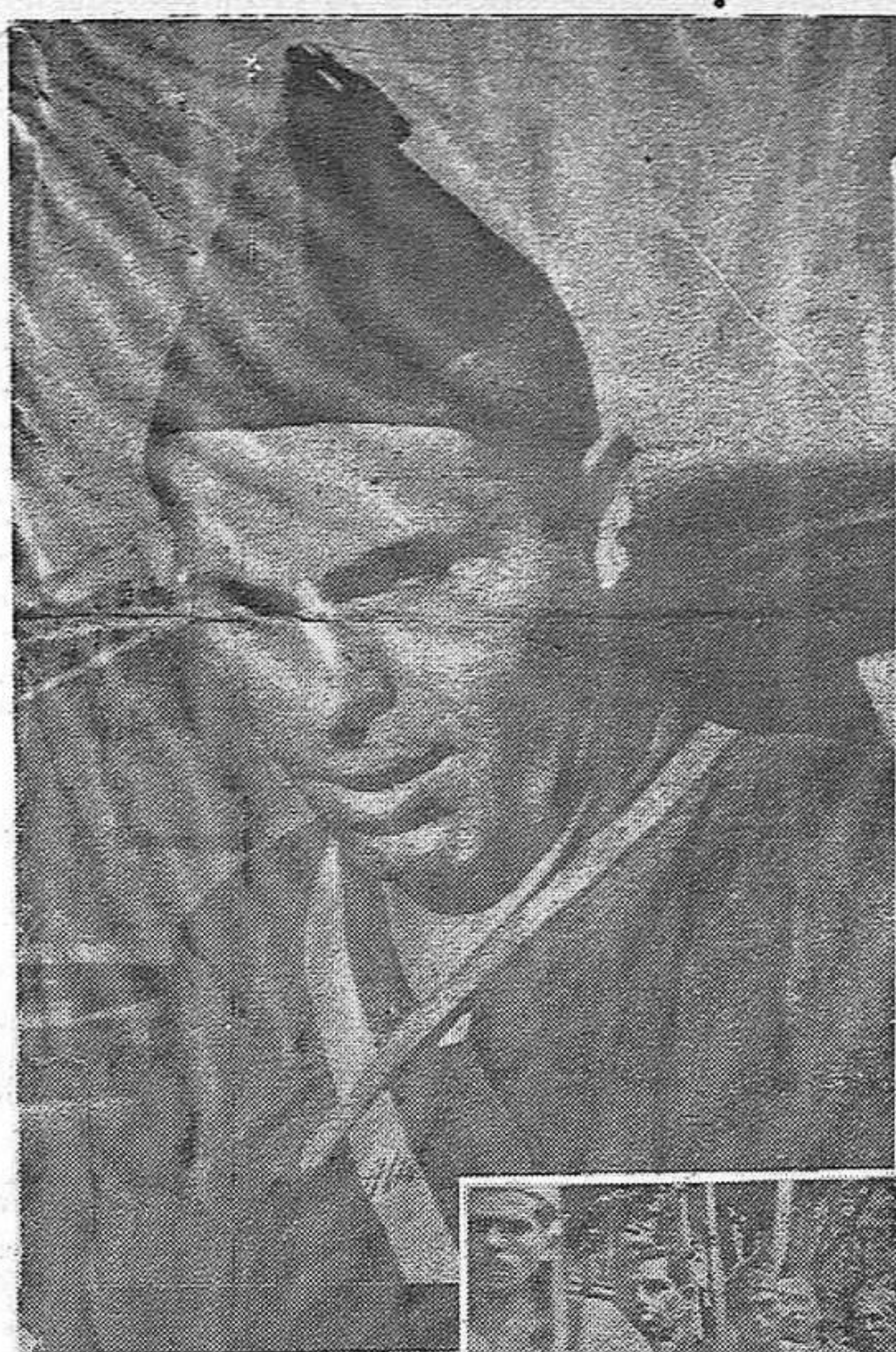
Les militants de la C.N.T. ont donné l'exemple et ont élevé le moral des miliciens.