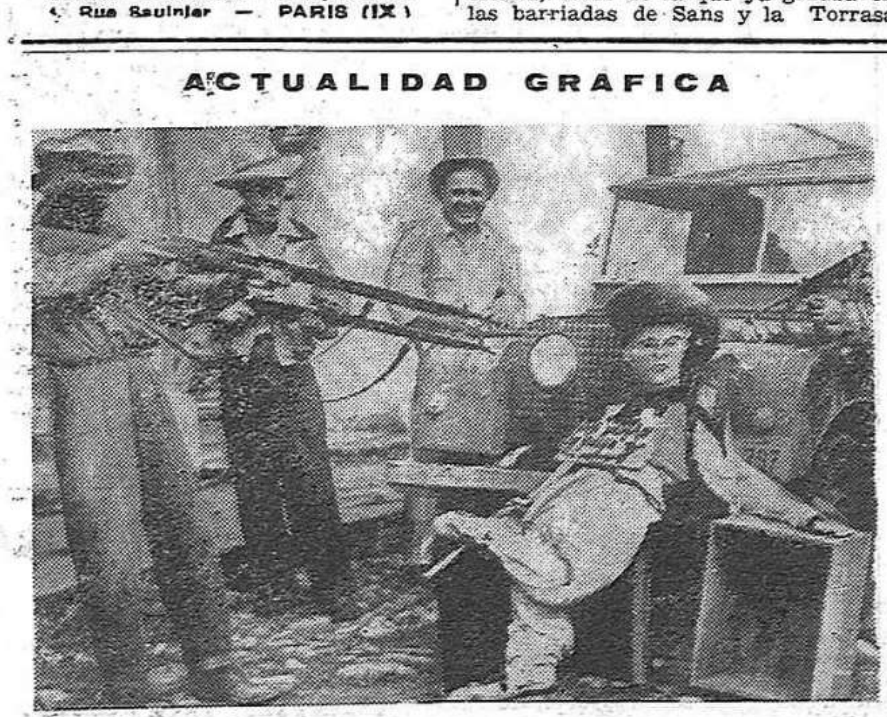
Triunfantes los facciosos en Guatemala, su primer acto de gobierno — al servicio de la « United Fruit » — anula la expropiación de tierras. En las calles, los adictos de la Junta hacen constantes provocaciones, algunas tan ridiculas como la que presenta la foto, que simula ejecución del presidente Arbenz, a quien, presentándolo como « comunista », le colocaron un cartel que decía: « Me vuelvo a Rusia con Arévalo », es decir, el anterior presidente, también censurado de « comunista ».