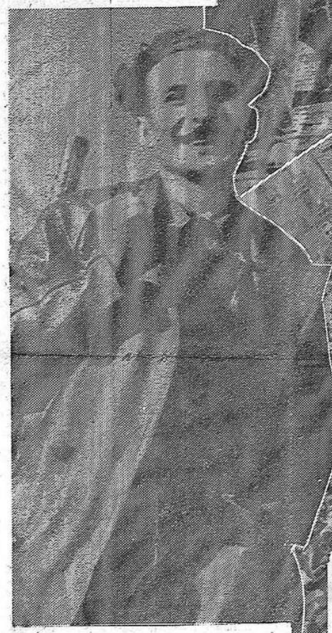
Nos valeureuses femmes ont exalté l'atmosphère de la rue et insufflé le courage dans le cœur des hommes.