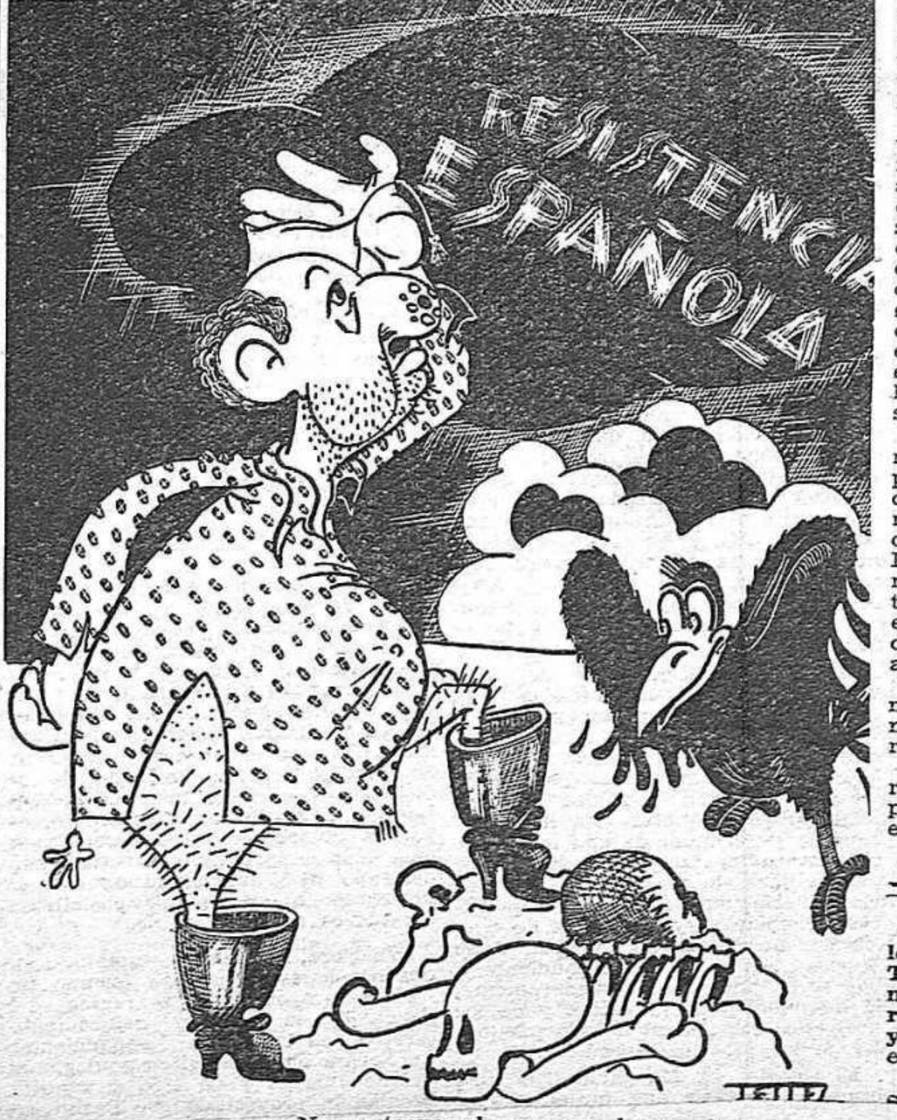
— No me toques el perro, que lo necesito.

política, la libertad civil. Existen en derecho, no en hecho. Ni el intento de convertir el derecho en hecho está permitido a muchos, a la inmensa mayoría. No puede, el que depende económicamente de otro, proclamarse libre. Está sometido. Digan lo que