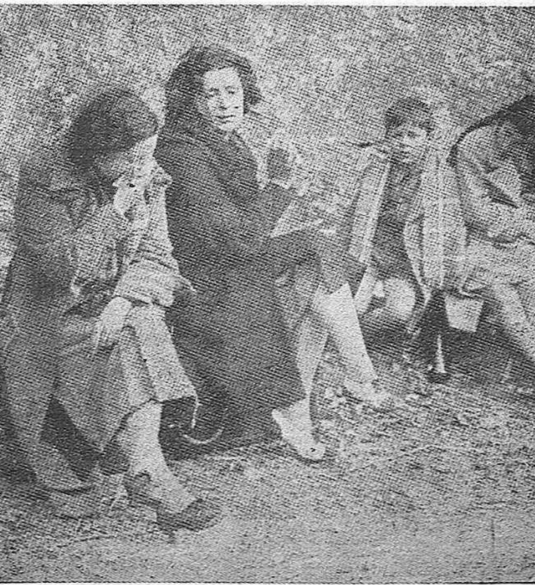
EL EXODO. Hace 19 años!