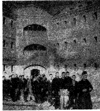
Interior de un presidio franquista

mayor de la Tierra, no le remuerde la conciencia el haber hecho verter la sangre de los hijos del pueblo español a torrentes. Aun tiene el cinismo de querer infamar a aquellos que tuvieron la dignidad de defender las libertades del pueblo español, de oponerse a la entronización de los pretorianos, y de cuantos han caído en las redes de la policía por actividades clandestinas, de resistencia, de reorganización sindical; por defender sus