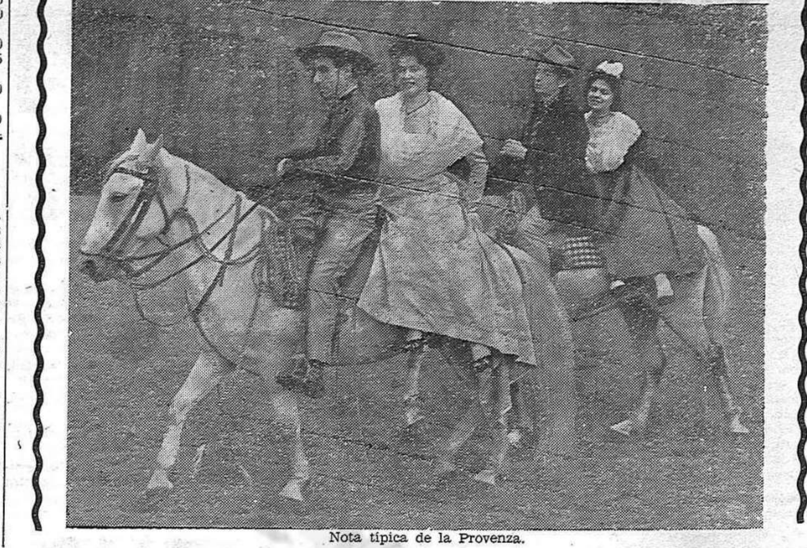
Nota típica de la Provenza.