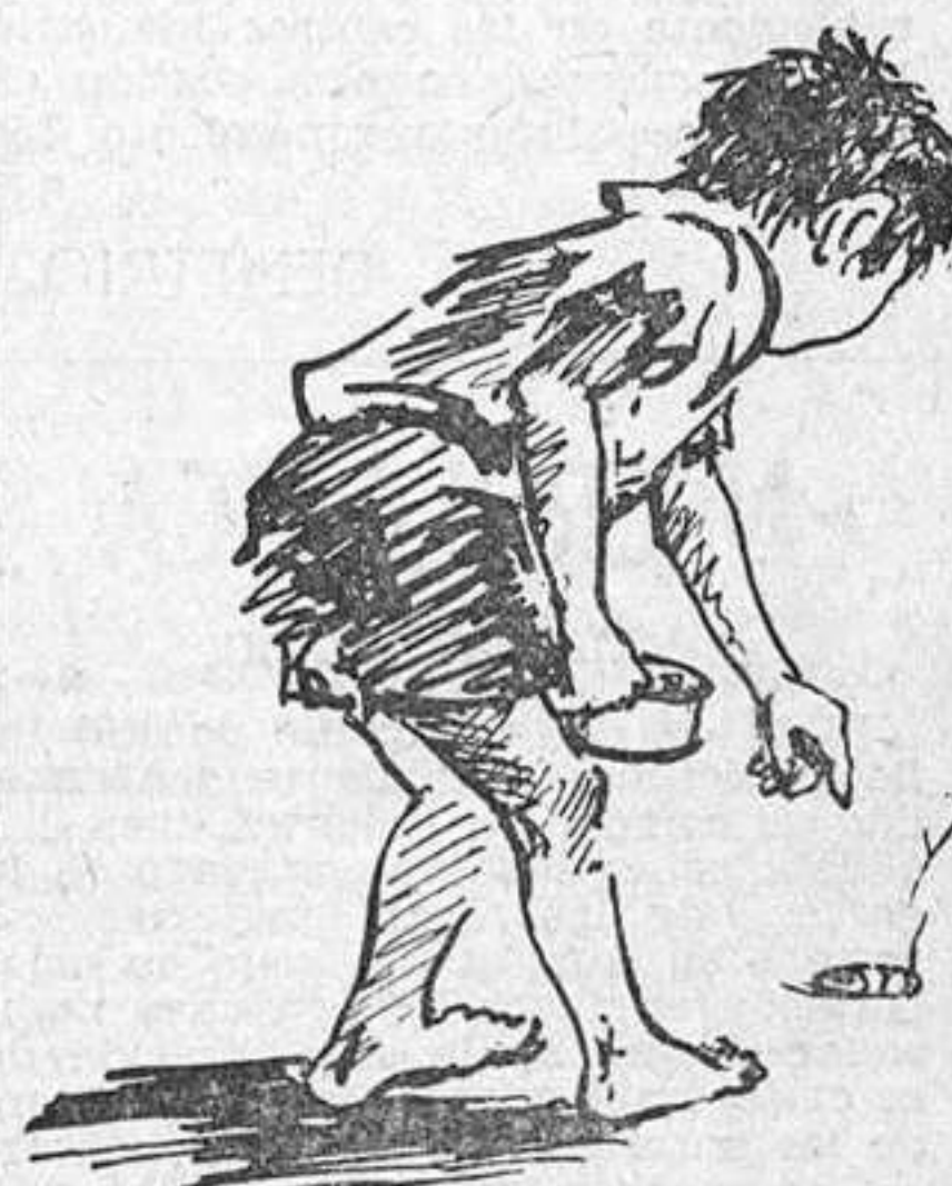
ESTAMPA ESPAÑOLA. — Protección a la infancia...

HUELGA DE BRAZOS CAIDOS MADRID, (OPE). — Para protestar de los bajos sueldos y pedir la dignificación de la profesión, los jueces y magistrados de Sevilla estuvieron cinco días sin despachar.