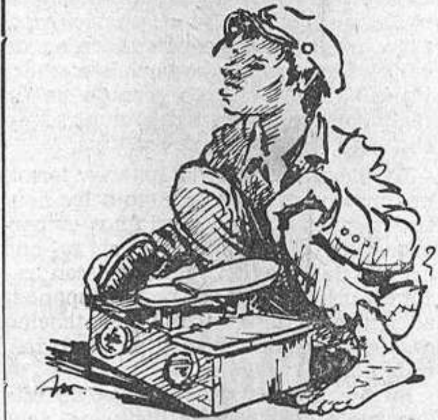
ESTAMPA ESPAÑOLA. — Universidades laborales...

— o — P. S. — La historia del mencionado «milagro» es muy conocida en Poitiers. Una prueba de ello, es que un café, que está al lado de la iglesia, lleva el nombre de «Au pas de Dieu». («La huella de Dios»). El mismo nombre ha sido adoptado por una pequeña librería piadosa del barrio. Visite usted las iglesias, reverendo Padre. En ellas puede usted instruirse de vez en cuando si es usted observador.