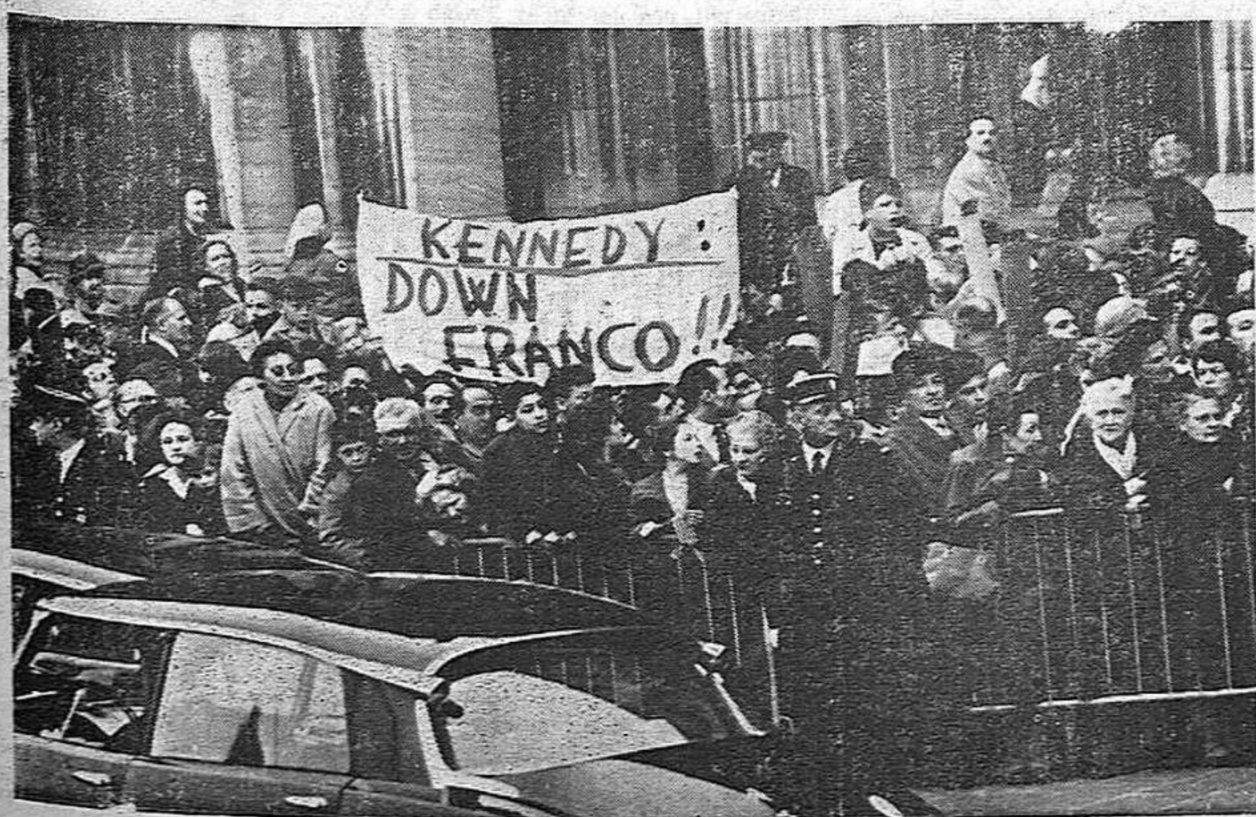
Primavera de 1961. Ante el Presidente: «Kennedy: ¡Abajo Franco!»

Recién aparecido. Precio 5,00 N.F. Es una edición «SOLI»